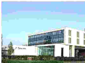
Il palazzo di Tetra Pak a Modena

Un balzo in avanti di undici posizioni rispetto allo scorso anno. Lo ha fatto Tetra Pak, azienda nata in Svezia e oggi in 160 Paesi con oltre 24 mila dipendenti: è passata alla posizione numero 8 dalla 19 del 2023. Il business è sempre quello: produrre confezioni per il cibo che siano di minor impatto possibile sul Pianeta. Per questo la ricerca scientifica su nuovi materiali o soluzioni innovative è una porta sempre aperta. Come il reclutamento di giovani che possono partecipare al Future Talent. Nei 18 mesi dell'iniziativa si potrà seguire un percorso di Leadership che punta a sviluppare le abilità per guidare