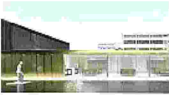
A Marghera l'atelier di Golden Goose

T ra le aziende più giovani presenti nel ranking, Golden Goose (fondata nel 2000, qui in posizione numero 407) produce le sneakers di lusso: doveva quotarsi in Borsa nelle scorse settimane, ma il progetto è stato sospeso. La decisione non ha scalfito i tre pilastri del welfare a vantaggio dei dipendenti. A partire dal Golden Goose For You, come le iniziative per chi opera tra store e quartier generale con programmi di smart working, flessibilità negli orari, un servizio di assistenza (conciergerie) per il disbrigo di pratiche varie. C'è poi il pilastro Your Lovers dedicato ai familiari nel senso più largo: