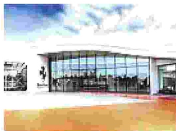
Il museo Ferrari a Maranello

Magari i soldi non fanno la felicità, ma se l'azienda aumenta la busta paga anche il gradimento va meglio. Almeno succede così per la Ferrari di Maranello che si piazza al gradino numero 13 del ranking di Statista (con 9,16 punti) mentre un anno prima si era fermata alla posizione 37. Una bella spinta può averla data l'assegno da 13.500 euro una tantum staccato come premio ai dipendenti, visti gli eccellenti risultati di bilancio del Cavallino rampante. Per carità, nel 2022 il bonus era stato già alto (12 mila euro) e comunque nel contratto integrativo è previsto un impegno ad aumentare la