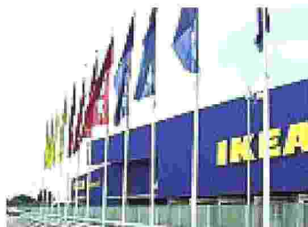
Il magazzino Ikea a Roncadelle (Bs)

Li chiamano co-worker e in Italia sono 7.871, secondo i dati del Report di sostenibilità 2023. Le donne sono il 59% contro il 41% degli uomini. Il 47% delle lavoratrici di genere femminile sta in posizioni apicali e di responsabilità. Ma il colosso svedese di mobili e arredo per la casa va oltre: «In Ikea riconosciamo l'esistenza di una pluralità di identità e ci impegniamo a valorizzarle. Siamo storicamente al fianco delle comunità LGBTQ+ attraverso una molteplicità di azioni e attività». Al fianco dell'associazione Parks - Liberi e Uguali, l'azienda si impegna a