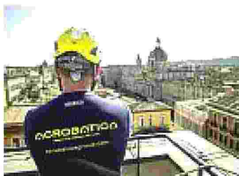
Uno degli operai di Acrobatica

Una Academy per il personale non bastava, così ne hanno aperta una seconda. La prima è dedicata al management e a chi sta in ufficio, l'altra è per gli operatori su fune, che si calano dal tetto per imbiancare o ristrutturare le facciate degli edifici. «Ogni iniziativa di Acrobatica parte dalla valorizzazione delle proprie persone: sono loro il centro di tutto ed è a loro che dedichiamo la nostra maggiore attenzione affinché possano realizzare se stesse all'interno dell'azienda e viverla come luogo in cui crescere e migliorare costantemente. Crediamo nel valore della formazione», spiega