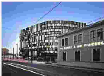
Il Museo Lavazza a Torino