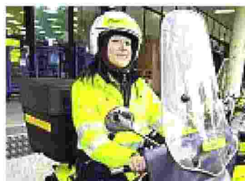
Una giovane postina a Imperia

Un giaccone, un gilet e un palmare. Sta in questi tre oggetti il senso di Poste Italiane (posizione 215) per la salute dei dipendenti, postini in primis. Naturalmente, non si esauriscono qui i piani di welfare del gruppo ma nell'ottica della prevenzione tali strumenti sono importanti. E sono quelli che vengono dati appunto ai portalettere per l'esercizio della loro attività, dalla consegna di cartoline ai pacchi acquistati, in fondo il mestiere non è cambiato. Le divise hanno la certificazione Oeko-Tex che garantisce il controllo ecologico sui tessuti. Sono realizzate usando componenti riciclati e le