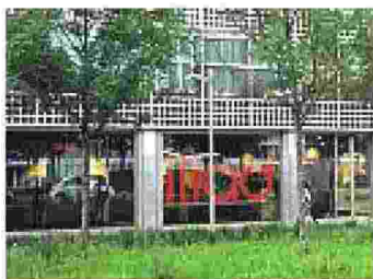
La sede di Iliad a Milano

Arrivata in Italia (dalla Francia) nel 2018, Iliad dà lavoro a 997 persone e sul mercato ha oltre 10,7 milioni di clienti per la telefonia mobile, ma molti di meno (820mila) per la rete fissa. Azienda giovane, punta sulla sostenibilità: negli ultimi mesi dell'anno scorso è stata condotta la prima analisi per capire l'impatto ambientale e sociale prodotto dall'azienda. Il contesto, i rischi, le opportunità sono passate al vaglio delle gerarchie interne oltre che dei dipendenti e confrontate con gli stakeholder: le comunità locali, le associazioni di categoria. Un tale lavoro ha permesso di identificare alcune priorità di